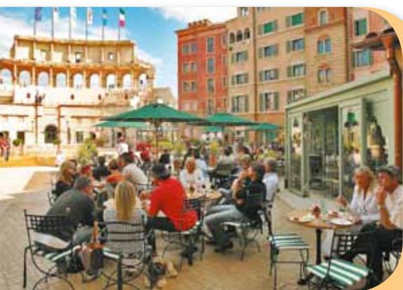
Bar « Commedia dell'Arte »