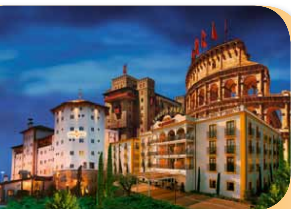
« Hôtel Resort »

Venez profiter du confort de nos hôtels après une merveilleuse journée à Europa-Park !