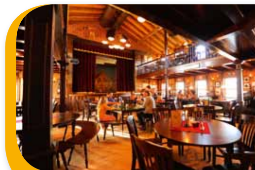
« Silver Lake Saloon »